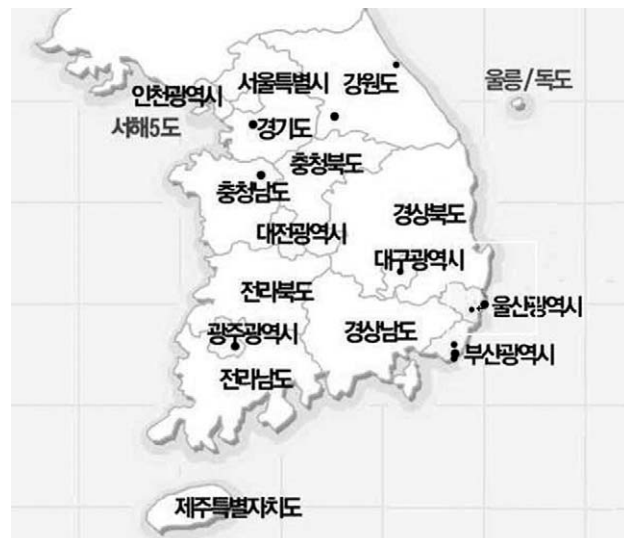
Fig. 4. Emergency medical centers currently equipped hyperbaric oxygen apparatus.

고압산소 치료 후 발생하는 부작용이나 합병증으로 가장 큰 것은 압력 손상으로 알려져 있으며 6,9,28) , 본 연구에서는 귀통증이 21례와 혈성고막이 5례로 중이에 대한 압력