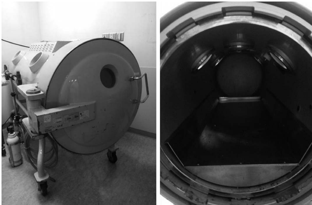
Fig. 2. Hyperbaric oxygen apparatus currently operated in Ajou University Hospital.

대상 기간 동안 총 233명의 환자들이 고압산소 치료를 시행 받았으며, 평균 연령은 45.9 \pm 17.7 세였고, 남성이 여성보다 2배 가량 많았다. 입원과는 응급의학과가 153명으로 65.7%, 성형외과가 69명으로 29.6% 등이었다. 자세한 내용은 Table 1과 같다.